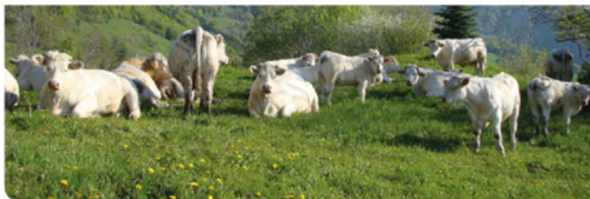
Herd Book Charolais - Agropôle du Marault - 58470 Magny-Cours - France