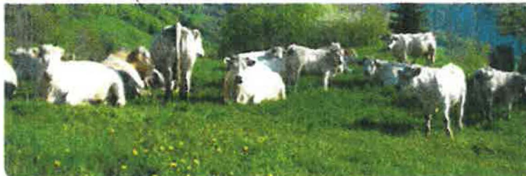
Herd Book Charolais - Agropôle du Marault - 58470 Magny-Cours - France